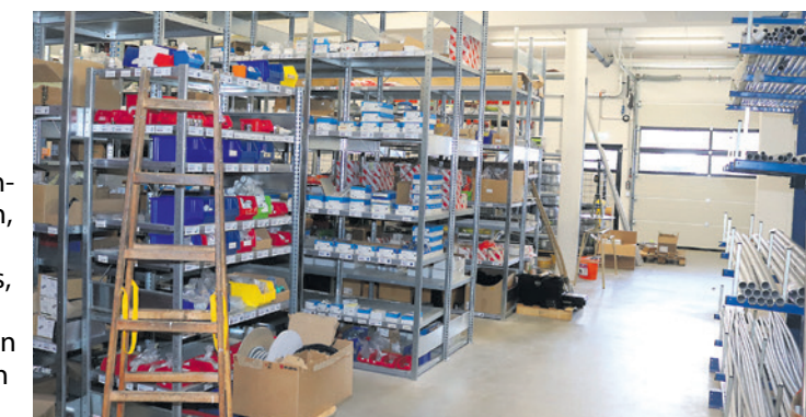
Das 350 m 2 große Lager inklusive Werkstätte.

Vis-à-vis der aze Technik GmbH und der Ripa Management + IT-Solutions GmbH betritt man das imposante, 15,5 Meter hohe Stiegenhaus, das zu den Geschäftsräumen der Ringhofer & Partner GmbH führt. Ein barrierefreier Zugang zu den drei Obergeschossen wird durch einen Personenaufzug gewährleistet.