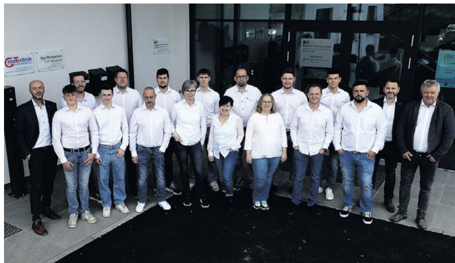
Das Team der aze Technik GmbH ist im Erdgeschoss zuhause.