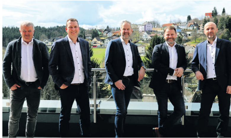
Das fünfköpfige Geschäftsführungs-Team der Ringhofer Gruppe.