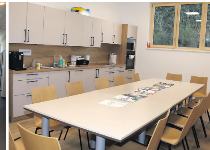
Der Sozial- und Pausenraum im Erdgeschoss.