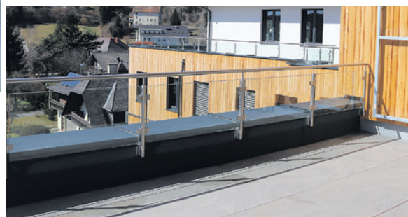
Frischlucht für neue Ideen bieten die zahlreichen Terrassen.