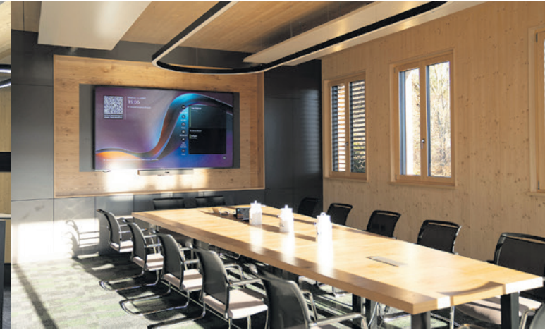
Die Besprechungsräume sind mit High-Tech ausgestattet.