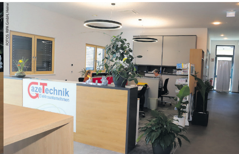
Die offen gestalteten Büros am Empfang.