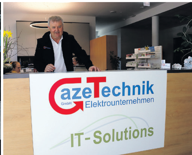
Der großzügige Empfangs- und Verkaufsraum.