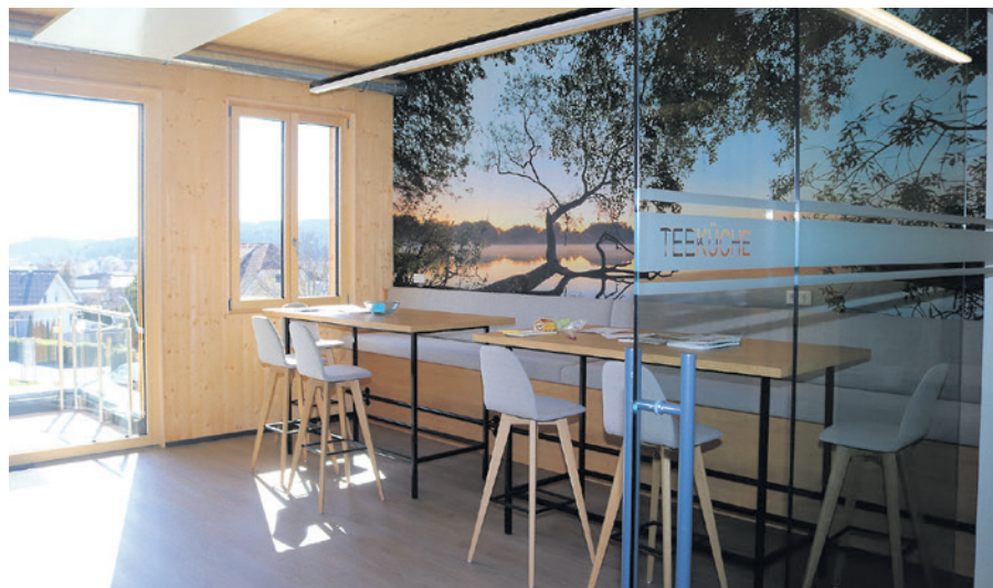
Eine der wunderschön gestalteten Teeküchen.