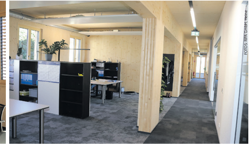
Die hellen und geräumigen Arbeitsplätze.