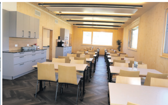
Der Aufenthaltsraum ist vor allem zu Mittag sehr belebt.